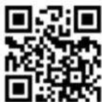
全国学生 资助管理中心网站

开学前后往往是电信、网络诈骗高发期，一些诈骗分子会冒充大学老师、资助机构工作人员等，给新生发短信、打电话、加微信或QQ好友，用各种手段骗取钱财，或发放互联网消费贷款，引诱学生陷入高额贷款陷阱。请你一定擦亮眼睛，提高警惕，抵住诱惑，避免上当。要想了解学生资助政策的更多内容，请关注“中国学生资助”（jybzzzx）、“四川学生资助”微信公众号（scxszzz）和全国学生资助管理中心网站（ http://www.xszz.cee.edu.cn ）、四川省学生资助管理中心网站（ https://www.scxszz.cn/ ）。