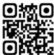
四川省学生 资助管理中心网站