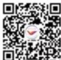
“中国学生资助” 微信公众号