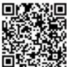
“四川省学生资助” 微信公众号

在高等教育本专科阶段，目前已建立起国家奖学金、国家励志奖学金、国家助学金、国家助学贷款、学费补偿国家助学贷款代偿等多种形式有机结合的高校学生资助政策体系。（如遇国家政策调整，以新政策文件为准执行）